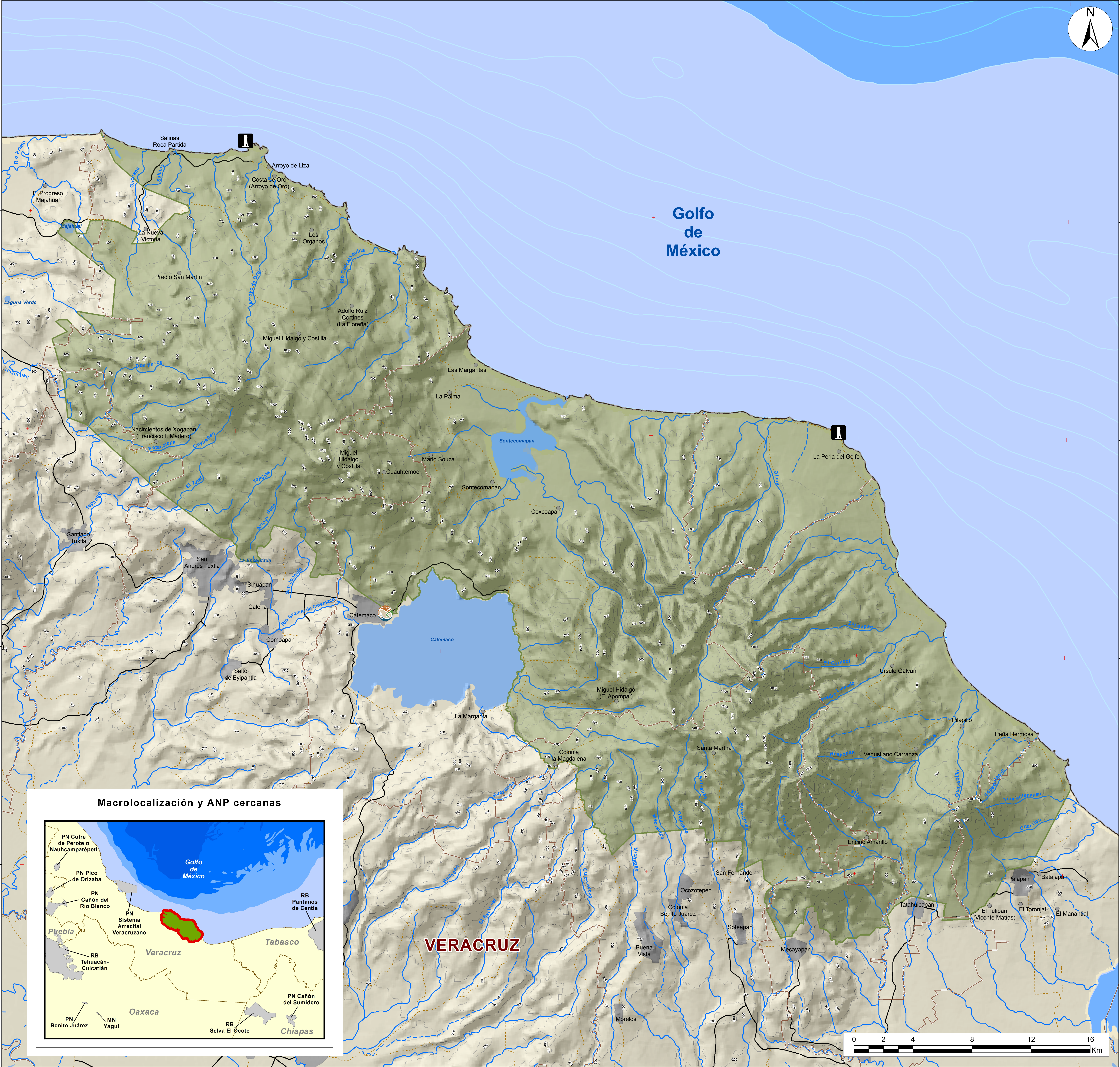
Macrolocalización y ANP cercanas